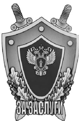
РИСУНОК нагрудного знака «За заслуги»

к Положению о нагрудном знаке «За заслуги»